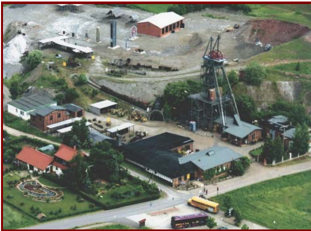
Bergbaumuseum Röhrichtschacht Wettelrode - 2007