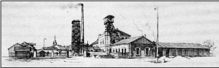
Schacht Maria, Březové Hory (Birkenberg)

Anfang September werden Mitglieder unseres Vereins diese alte Bergbaustadt besuchen.