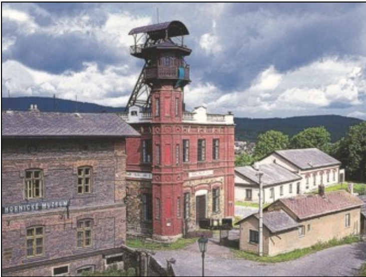
Schacht „Důl Ševcův“ (ehemals Kaiser-Franz-Josef-Schacht)

Heute ist das Lager eine Gedenkstätte, die auf Initiative des verstorbenen Staatspräsidenten Václav Havel im Jahr 2005 eröffnet wurde.