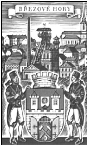
Wappen des Stadtteiles Birkenberg

Přebram ist eine sehr alte Stadt. Sie liegt etwa 50 km südwestlich der Landeshauptstadt. Aus dem Jahre 1216 stammt ein Beleg über den Kauf eines dort gelegenen Gutshofes. Im 14. Jahrhundert ist bereits ein Silber- und Bleierzlager bekannt. Im 16. Jahrhundert wird Přebram durch ein Privileg Rudolf II. „Königliche Bergstadt“. In unmittelbarer Nähe liegt Březové Hory (Birkenberg). Anfang des 16. Jahrhunderts durch den sich rasch entwickelten Bergbau gegründet. Der Ort wurde 1896 von Franz Josef I. ebenfalls zur Bergstadt erhoben. Im Wappen sind das Bergbausymbol und die Mondsichel als Symbol für Silber zu finden. Die Stadt wurde 1953 in Přebram eingemeindet. Erste genaue Angaben zur Bergbautätigkeit sind aus dem Jahre 1527 überliefert. Daraus ist zu entnehmen, dass bereits 33 Silber- und Bleierzgruben in unmittelbarer Umgebung betrieben wurden.