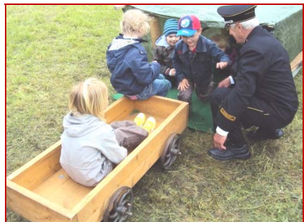
Die Strebfahrt – bei jedem Kindefest eine Attraktion