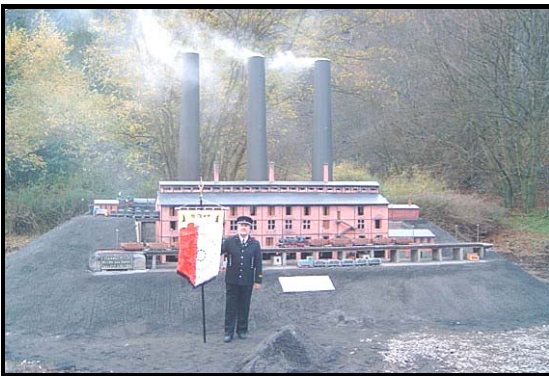
Das Hüttendenkmal in Wimmelburg