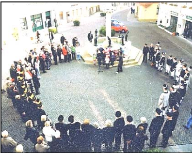
Feierstunde am Knappenbrunnen

Nicht nur die Schaffung neuer Denkmale, sondern auch der Erhalt der vorhandenen Sachzeugen des Bergbaus ist Anliegen des Vereins. Eine Renovierung des 1983 vom Mansfeld Kombinat an die Stadt übergebenen Brunnens machte sich notwendig und sollte durch das Anbringen von Namensbezeichnungen für die Bronzefiguren touristenfreundlicher gestaltet werden.