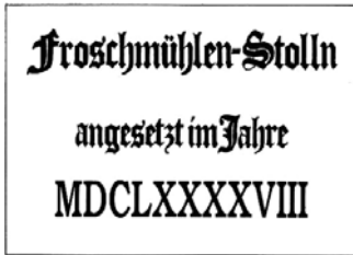
GRAFIK: Klaus Foth