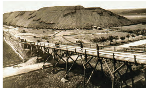
Erzgewinnung am Haldenfuß des Glückhilf-Schachtes

Die gesamte Erzgewinnung im Jahr 1915 lag mit 936.000 t bei ca. 117 % gegenüber dem Ergebnis des Vorjahres. Eine Erklärung lieferten u. a. die gesteigerte Erzgewinnung von Halden sowie der Einsatz von einer unbekannt Anzahl von Kriegsgefangenen im Bergbau.