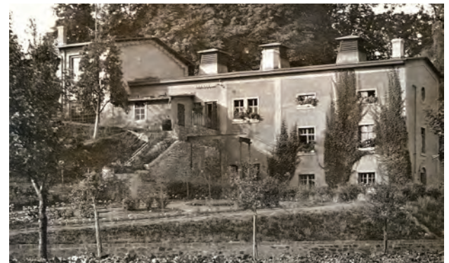
Ansicht des W-Schachtes in Wimmelburg in den 1930er Jahren

Bereits im Jahr 1915 war die große Hoffnung der Menschen auf ein schnelles Kriegsende gesunken. In zeitgenössischen Berichten beschreibt man es mit Fügung, dass im Oktober 1915 ein neuer Mansfelder Segenstaler mit dem Ritter Georg und dem Spruch „Bei Gott ist Rat und Tat“ herausgegeben wurde. Man schrieb dazu, „dass er in die jetzige große Zeit vortrefflich hineinpasst“ und dass der Mansfelder Bergbau berufen ist „durch seine Erzeugnisse aller Art zu einem nicht geringen Teile an der gewaltigen militärischen Rüstung unseres Vaterlandes mitzuarbeiten“. Am Ende des Jahres 1915 waren ca. 4.500 Mann aus den Betrieben im Mansfelder Revier zum Kriegsdienst eingezogen. Viele von ihnen, ohne dass ihre genaue Zahl in den zeitgenössischen Berichten und Artikeln genannt wurde, sahen das Mansfelder Land nicht wieder. Ihr sinnloses Sterben ist für uns heute Mahnung und Verpflichtung zugleich.