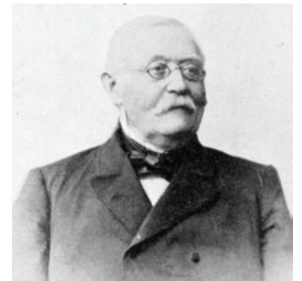
Ernst Hermann Otiliae (1821 – 1904)

Otiliae (1821 – 1904) gehören zu den bedeutenden Persönlichkeiten des Montanwesens, deren Wiege im Mansfelder Land stand. Wir wünschen, dass auch künftige Generationen diese Persönlichkeiten würdigen und bemerkenswerte Ereignisse der Industriegeschichte des Mansfelder Landes mit Interesse zur Kenntnis nehmen.