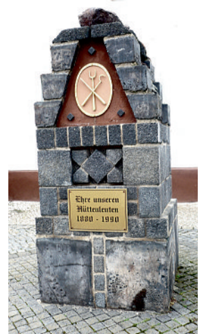
Gedenkstein für die Mansfelder Hüttenleute in Helbra

Abschließend sei noch gesagt, dass zwischen Helbra und Eisleben einige Millionen Tonnen Schlacke auf ihre Verwertung warten. Der Straßenbau könnte ein Einsatzgebiet der Schlacke auch in Zukunft bleiben, wenn auch Mansfelder Pflastersteine an deren große Bedeutung in der Vergangenheit erinnert wurde, nie wieder gegossen werden.