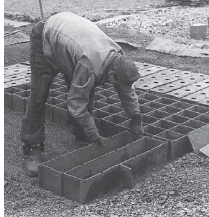
Facher bei der Herstellung der Gussformen.

In den Folgejahren wurden auf allen Rohhütten erfolgreich spezielle Versuche zur weiteren Verbesserung und Spezialisierung der Schlackenerzeugnisse als Straßenbaumaterial durchgeführt. Die „Gewerkschaftliche Chaussee- und Wegebauverwaltung“ begann 1865 mit der Verwen-