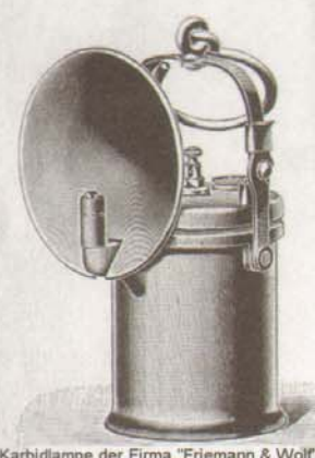
Karbidlampe der Firma „Friemann & Wolf“