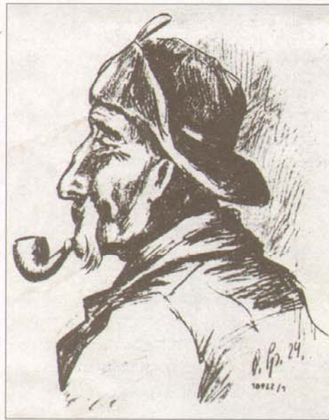
Der alte Hauer (1924)