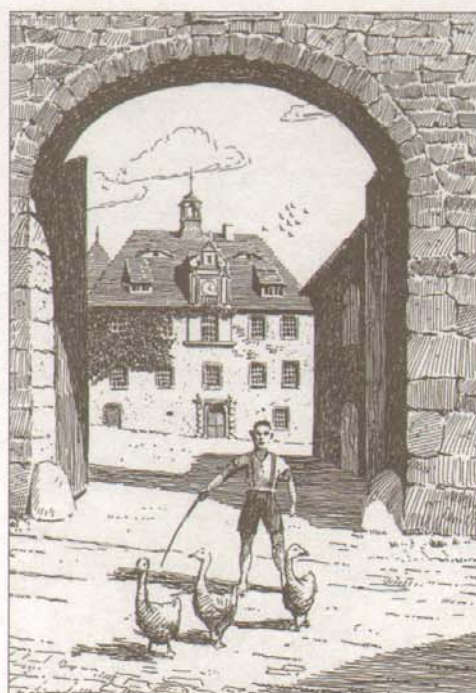
Klosterrode - Gut

„Fahren Sie denn bald los mit Ihrer Saukarre?“ „Ja, wo will denn die Sau hinfahren?“