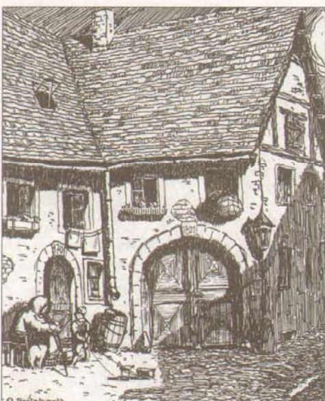
Altes Haus (1935)

ner Zeichnungen von Mansfelder Berg- und Hüttenleuten in ihrer Parade- oder Arbeitskleidung veröffentlicht, dabei auch die realisierte Ausführung der „Ehrenkleidung in der Metallurgie“ der DDR, die im Juli 1950 erstmals in der Öffentlichkeit gezeigt werden konnte. Anlässlich der Tagung der Bodendenk-