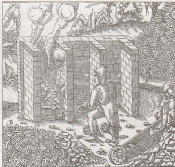
Röstschächte zum Rösten des Kupfers.

Es könnte reiner Zufall gewesen sein, daß die „Entdeckung“ in Hettstedt geschah und nicht an einem anderen, in der Nähe des Lagerstät-