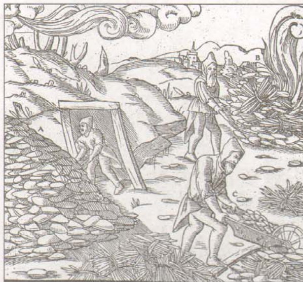
„Brennen“ des Kupfers.

Somit widerspiegeln die beiden Namen den Verarbeitungsgang des Kupferschiefers, dessen Hauptproblem im metallurgischen Sektor lag. Denn sowohl Kenntnis als auch das Beherrschen des notwendigen totalen Verschmelzens gingen weit über den damaligen Wissensstand hinaus, auch die Fähigkeit, die dazu erforderlichen Apparaturen (große Blasebälge; Nutzungsmöglichkeit von Wasserkraft mittels Wasserräder und Übertragungsmechanismen zum Antrieb der Bälge) zu bauen; das war hochspezialisiertes